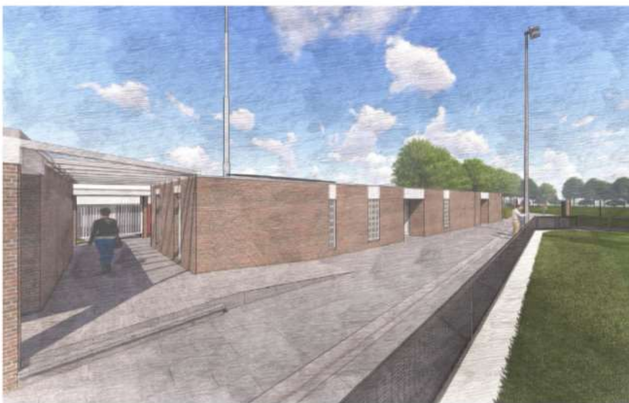
Schetsimpressie Renaud stuzie