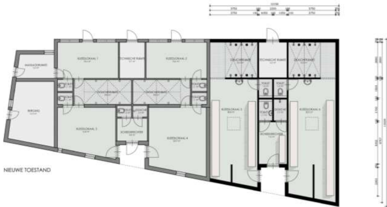
Bestaande kleedaccommodatie met nieuwe uitbreiding Bijzondere grond